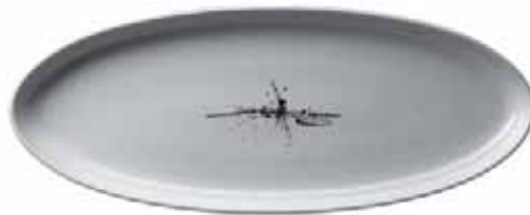
917 062 Platte oval schmal Platter oval narrow 62 x 25 cm 2500 g