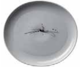
450 032 Teller oval Plate oval 32 cm 1020 g