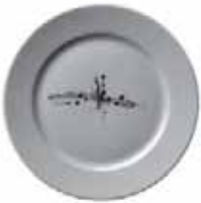
556 026 Teller flach Dinner plate 26 cm ø 715 g