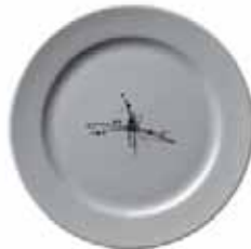
556 030 Teller flach Dinner plate 30 cm ø 920 g