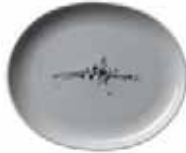
450 023 Teller oval Plate oval 23 cm 450 g