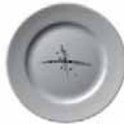
556 023 Teller flach Dinner plate 23 cm ø 550 g