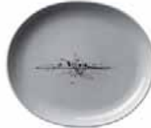
450 027 Teller oval Plate oval 27 cm 753 g