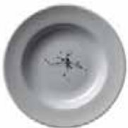
556 923 Teller tief Soup dish 23 cm ø 625 g