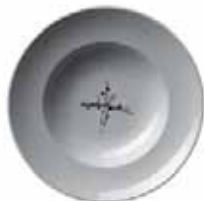
556 926 Teller tief Soup dish 26 cm ø 715 g