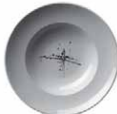
556 930 Teller tief Soup dish 30 cm ø 930 g