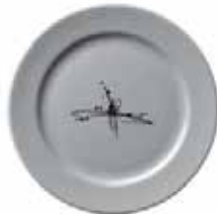
556 028 Teller flach Dinner plate 28 cm ø 850 g