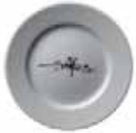
556 019 Teller flach Dinner plate 19 cm ø 330 g