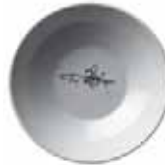
610 021 Eintopfschale Stew bowl 21 cm Ø 0,75 l 544 g