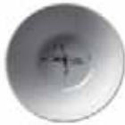
610 017 Cremeschale Cream bowl 17 cm Ø 0,65 l 442 g