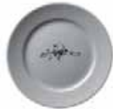
556 020 Teller flach Dinner plate 20 cm ø 400 g