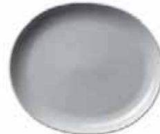
450 027 Teller oval Plate oval 27 cm 753 g