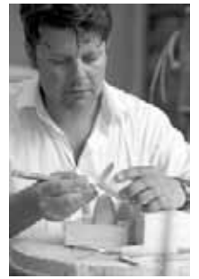
Design: Daniel Eitner