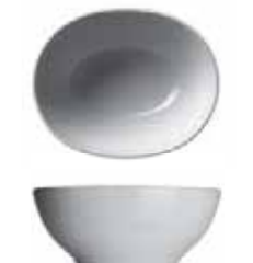
450 060 Suppenschale Soup bowl 0,6 l 350 g