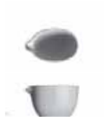
450 009 Buttersauciere Butter boat 0,09 l 100 g