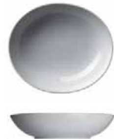
450 028 Schale oval Bowl oval 28 cm 860 g