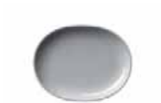
450 018 Teller oval Plate oval 18 cm 270 g