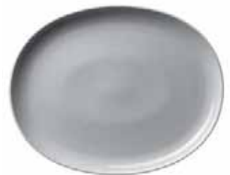
450 040 Platte oval Platter oval 40 cm 1680 g