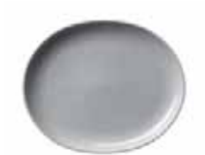
450 023 Teller oval Plate oval 23 cm 450 g