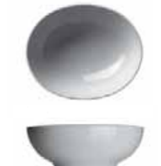
450 022 Schale oval Bowl oval 22 cm 615 g