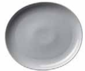
450 032 Teller oval Plate oval 32 cm 1020 g