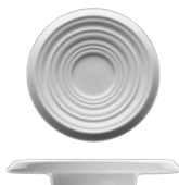
200 U 906 Kombi-Untertasse gerillt passend für 200 O 006 und 200 O 008 Universal saucer with patterned rills congenial to 200 O 006 and 200 O 008 165 g