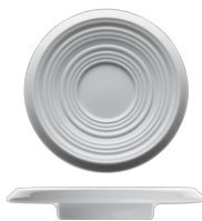
200 U 918 Kombi-Untertasse gerillt passend für 200 O 015, 200 O 018 und 200 O 028 Universal saucer with patterned rills congenial to 200 O 015, 200 O 018 und 200 O 028 250 g