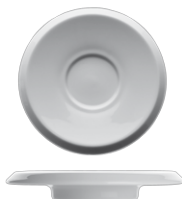
200 U 018 Kombi-Untertasse glatt passend für 200 O 015, 200 O 018 und 200 O 028 Universal saucer pure white plain surface congenial to 200 O 015, 200 O 018 and 200 O 028 235 g