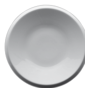
200 O 20 Teller flach Dinner plate 20 cm Ø 400 g