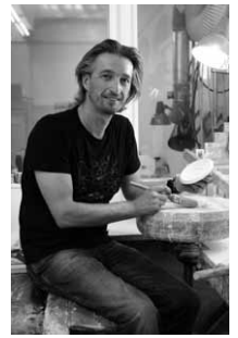
Design: Thomas Wenk