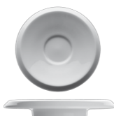
200 U 006 Kombi-Untertasse glatt passend für 200 O 006 und 200 O 008 Universal saucer pure white plain surface congenial to 200 O 006 and 200 O 008 165 g