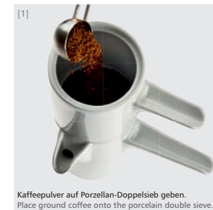
Kaffeepulver auf Porzellan-Doppelsieb geben. Place ground coffee onto the porcelain double sieve.