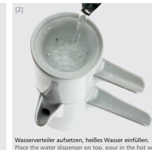
Wasserverteiler aufsetzen, heißes Wasser einfüllen. Place the water dispenser on top, pour in the hot water.