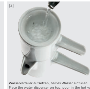
Wasserverteiler aufsetzen, heißes Wasser einfüllen. Place the water dispenser on top, pour in the hot water.