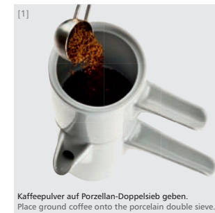
Kaffeepulver auf Porzellan-Doppelsieb geben. Place ground coffee onto the porcelain double sieve.