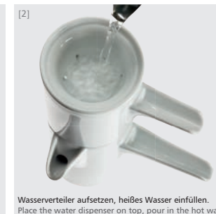
Wasserverteiler aufsetzen, heißes Wasser einfüllen. Place the water dispenser on top, pour in the hot water.