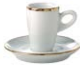
Weiß mit Goldrand white with golden edge

Diese Edelmetall-Varianten sind für alle Serien erhältlich: Those precious metal variations are available in all series: