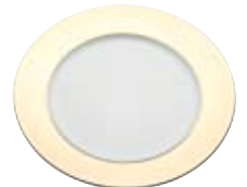
Fahne in Edelmetall Flag in precious metal