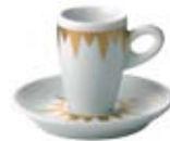
Dekor Stella (nur bei ALTA) Pattern Stella (only for ALTA)