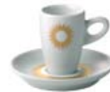
Dekor Sole (nur bei ALTA) Pattern Sole (only for ALTA)